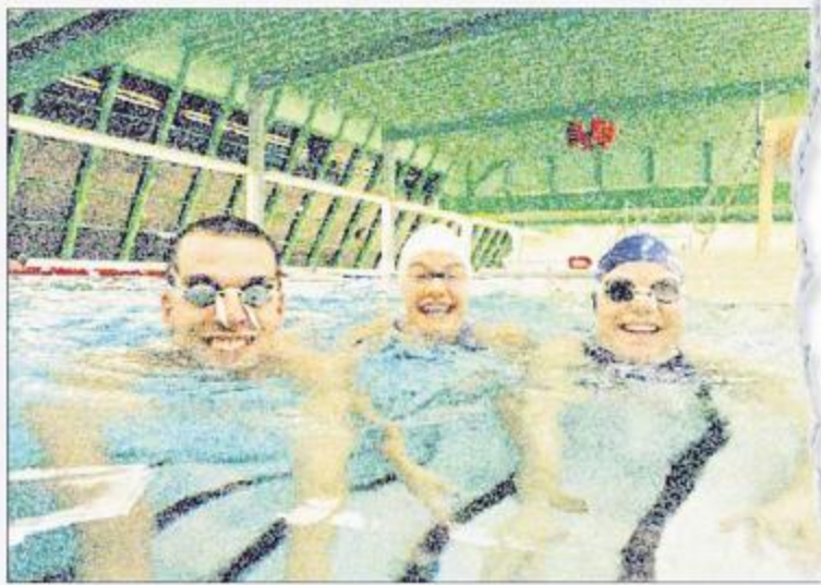
Wasser zuoberst Das Hallenbad Telli muss attraktiver und wirtschaftlicher werden.

Das ist entschieden zu viel – darüber sich der Kanton einig. Nur: Wie kann Malaise begegnet werden? Vorder-lig die einfachste Lösung: Das Hal-lenbad wird geschlossen. Auf diese Wei-se das Defizit ebenso schnell wie raft aus der Welt zu schaffen. Unsicher ist blicke im Falle eines sol-lenariens allerdings die Bedürf-nisse der Schwimmer zu decken. Ein Kanton, wäre indes kaum zu realis-ieren. Privatisierung in eine Einrich-tung. saniert werden. Zweitens muss das Hal-lenbad in betrieblicher Hinsicht opti-miert werden.